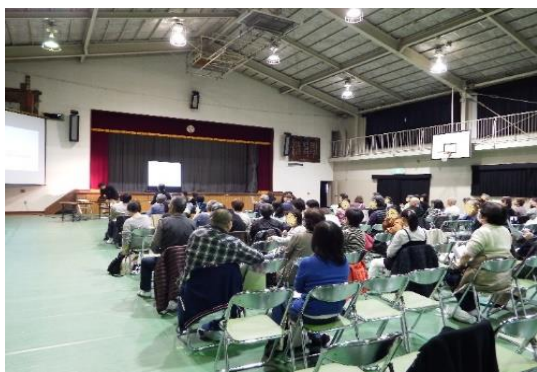
聴覚障害者福祉講座の様子

【問い合わせ先】 川崎市聴覚障害者情報文化センター 〒211-0037 川崎市中原区井田三舞町14-16 FAX 044-798-8804 電 話 044-798-8800