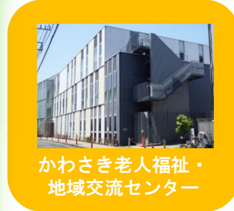
かわさき老人福祉・地域交流センター