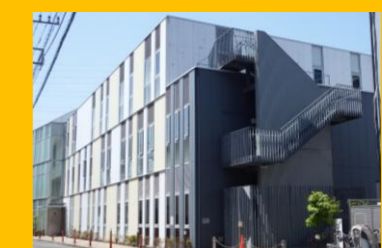
かわさき老人福祉・地域交流センター